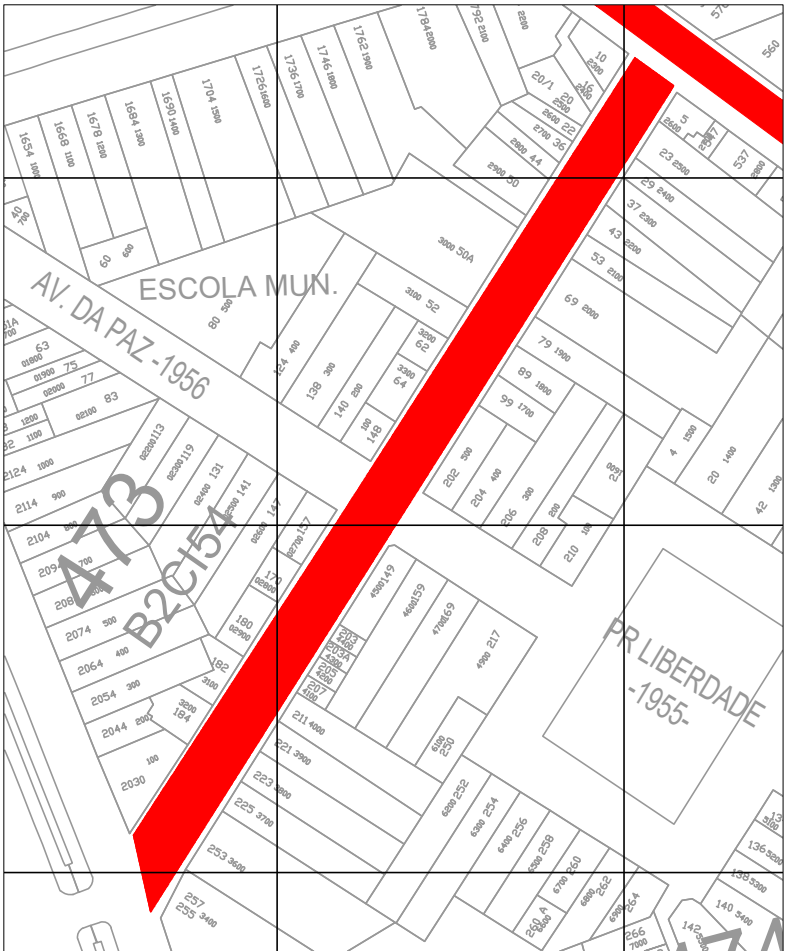
LOCALIZAÇÃO/SITUAÇÃO ESCALA 1/1000